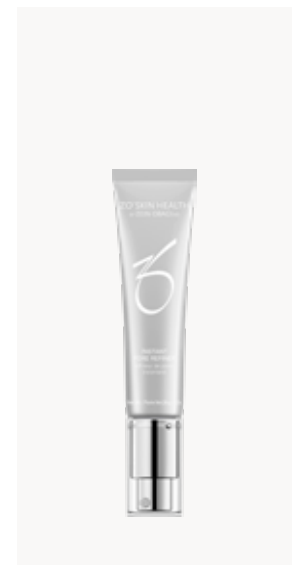
INSTANT PORE REFINER UJUTRO I NAVEČER