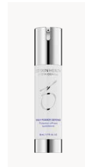
DAILY POWER DEFENSE UJUTRO I NAVEČER